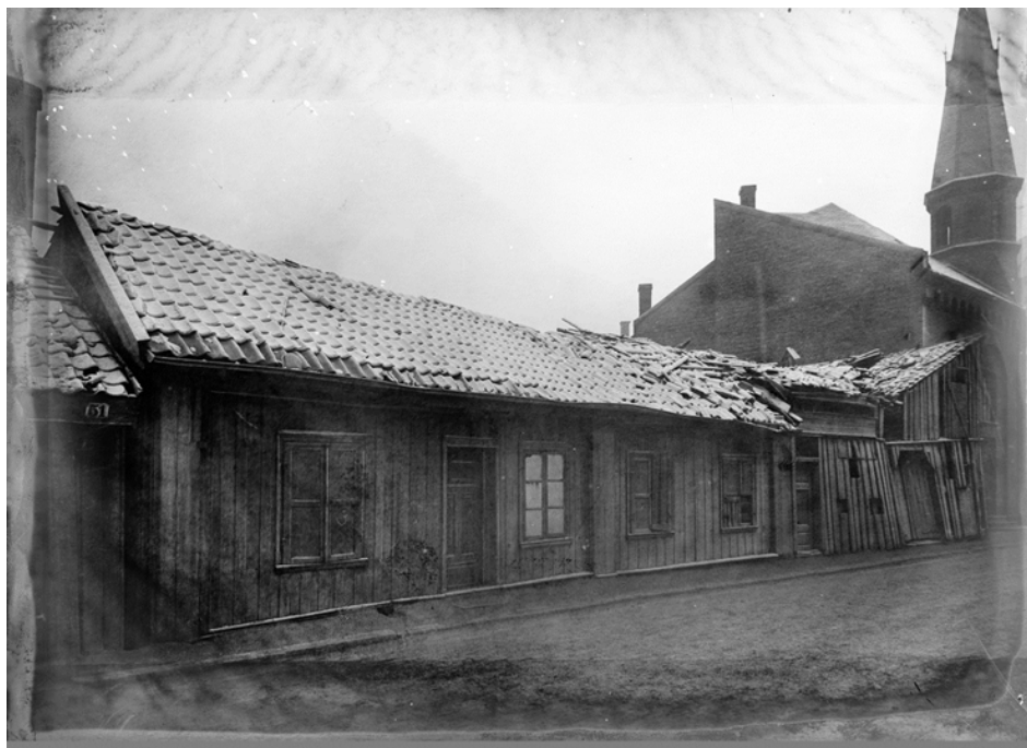
Lakkegata 49-51, trehusbebyggelse mot Østre Frikirke, snø på taket. År 1903. I dag er dette parkeringsplass.