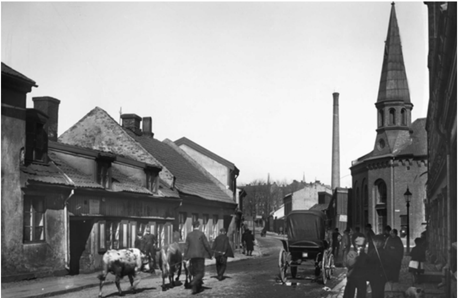
Kutørjgutta ved Frikirken, 1902

Så følger i Holms bok en lengre fortelling om arbeidet på nevnte Kutørje. Menigheten måtte søke tillatelse hos politiet flere ganger. Politiet fryktet bråk og opptøyer. Til slutt fikk menig-