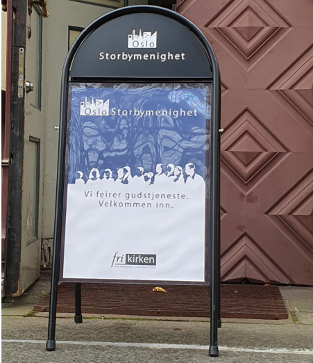
Storbymenigheten har flyttet inn i Vestre.

Vi tenker at det har vært en positiv og ukomplisert start på samarbeidet Vi har blitt veldig godt tatt imot, og det varmer