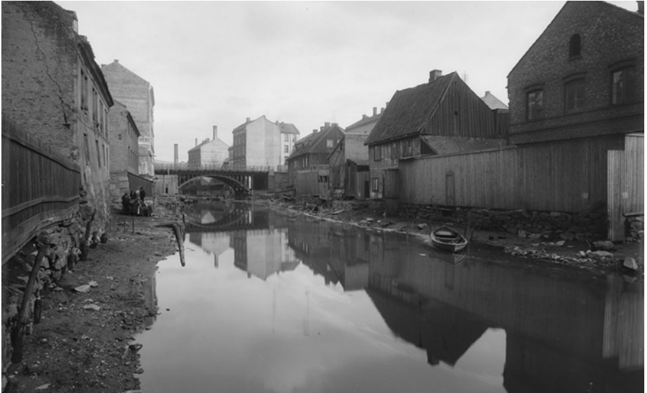
Hausmanns bru, sett fra Vaterland. År ukjent, mellom 1892 – 1910 (offentlig bilde).